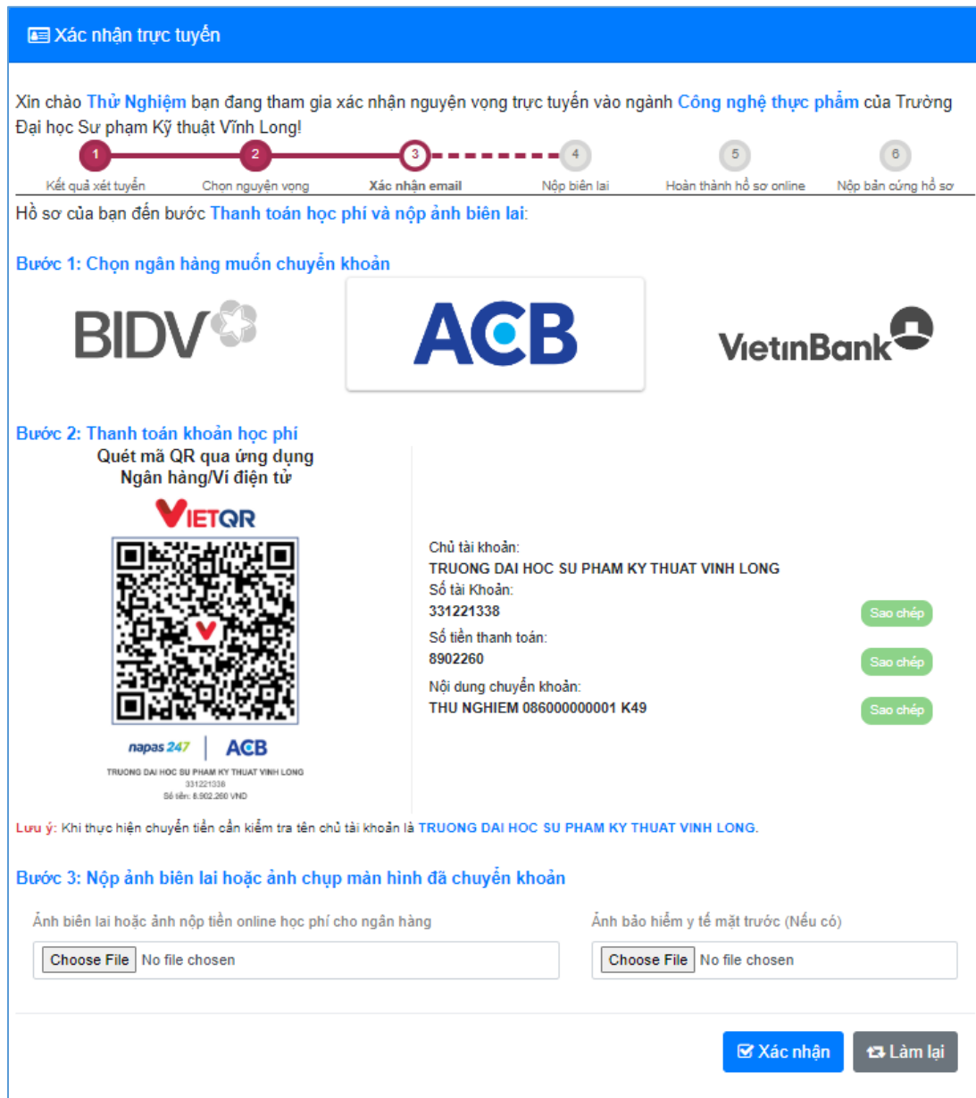
Hình 5: Minh họa bước chuyển khoản học phí